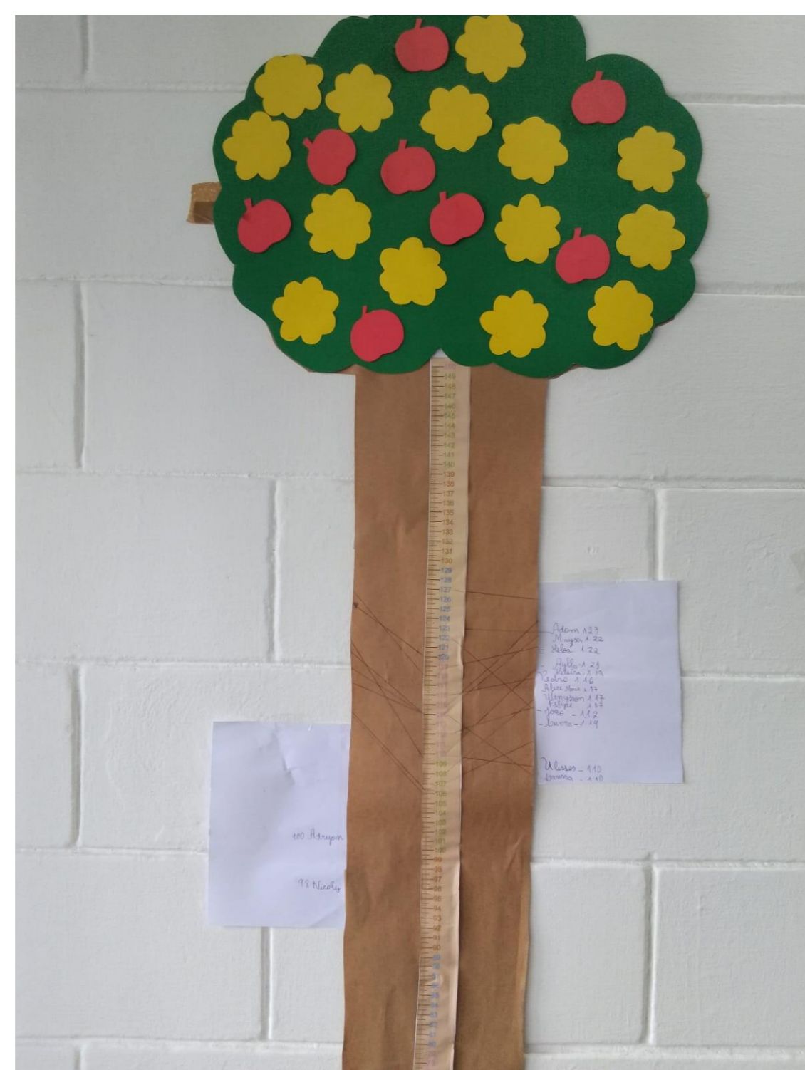
Imagem 1: Árvore do Tamanho

Fazer com que a criança perceba o seu desenvolvimento físico, estimulando o desenvolvimento das expressões corporal e afetiva.