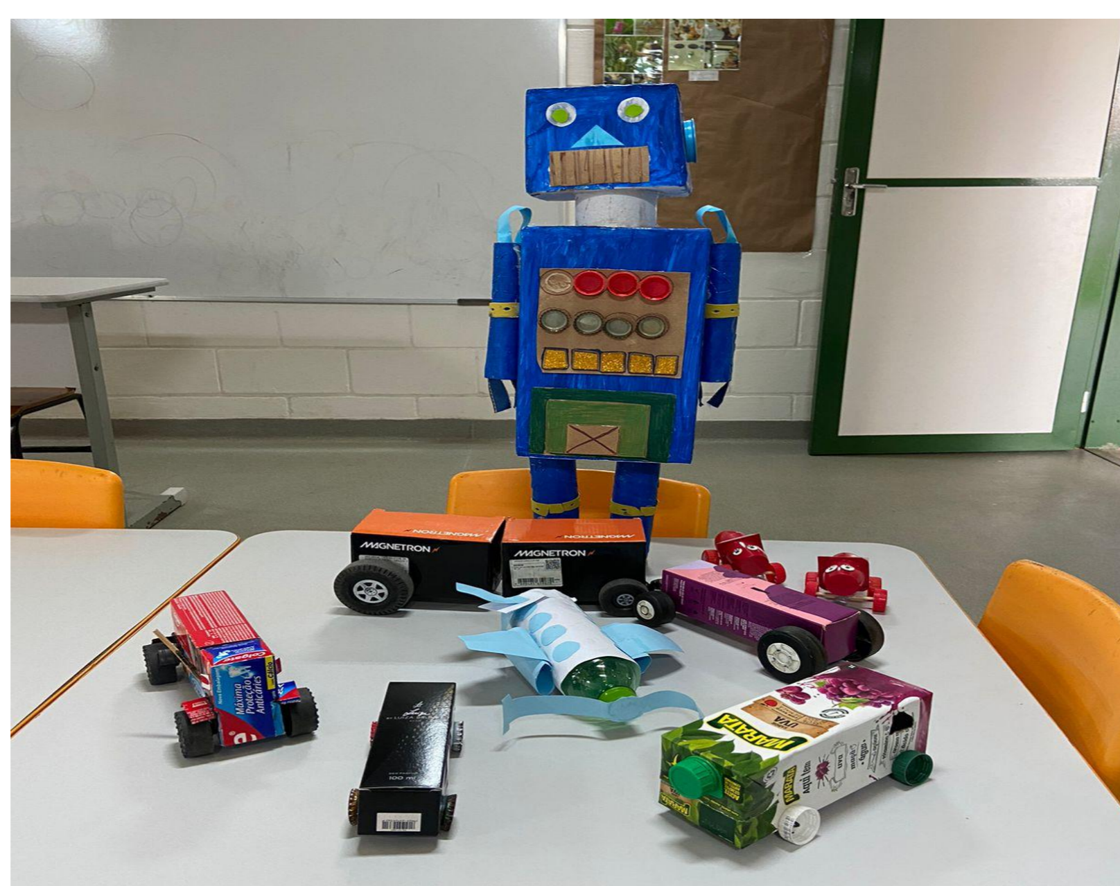
Imagem 1: Brinquedos de sucata

Conscientizar as crianças sobre o descarte correto do lixo, bem como ensinar o uso e reuso de materiais.